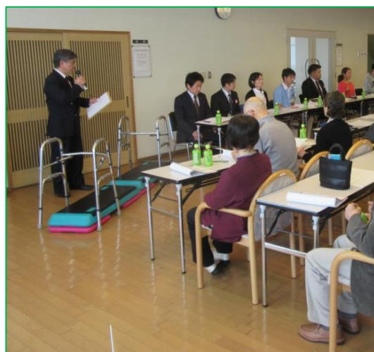
～新たな運動メニューの説明会の様子～ 平成 28 年 1 月 27 日 (水) 介護予防運動メニューや、使い方の説明など行いました。