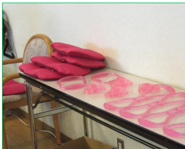
骨盤エクササイズクッションや 筋力アップ・ストレッチに 使用する運動用具